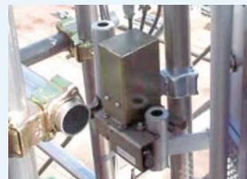
電磁ロック(オプション)